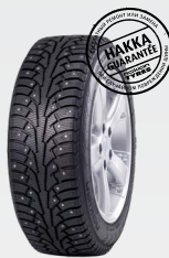
Ford Focus III 215/55R16 Hakkapeliitta 5 8 360 руб.