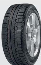
Latitude X-Ice 2