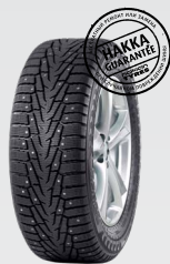
Ford Explorer 245/60R18 Hakkapeliitta 7 SUV 14 170 руб.