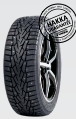
Ford Mondeo 215/55R16 Hakkapeliitta 7 9 270 руб.