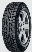
X-Ice north 2