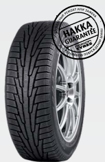
Ford Focus II 195/65R15 Hakkapeliitta R 5 540 руб.