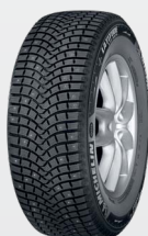
Latitude X-Ice north 2